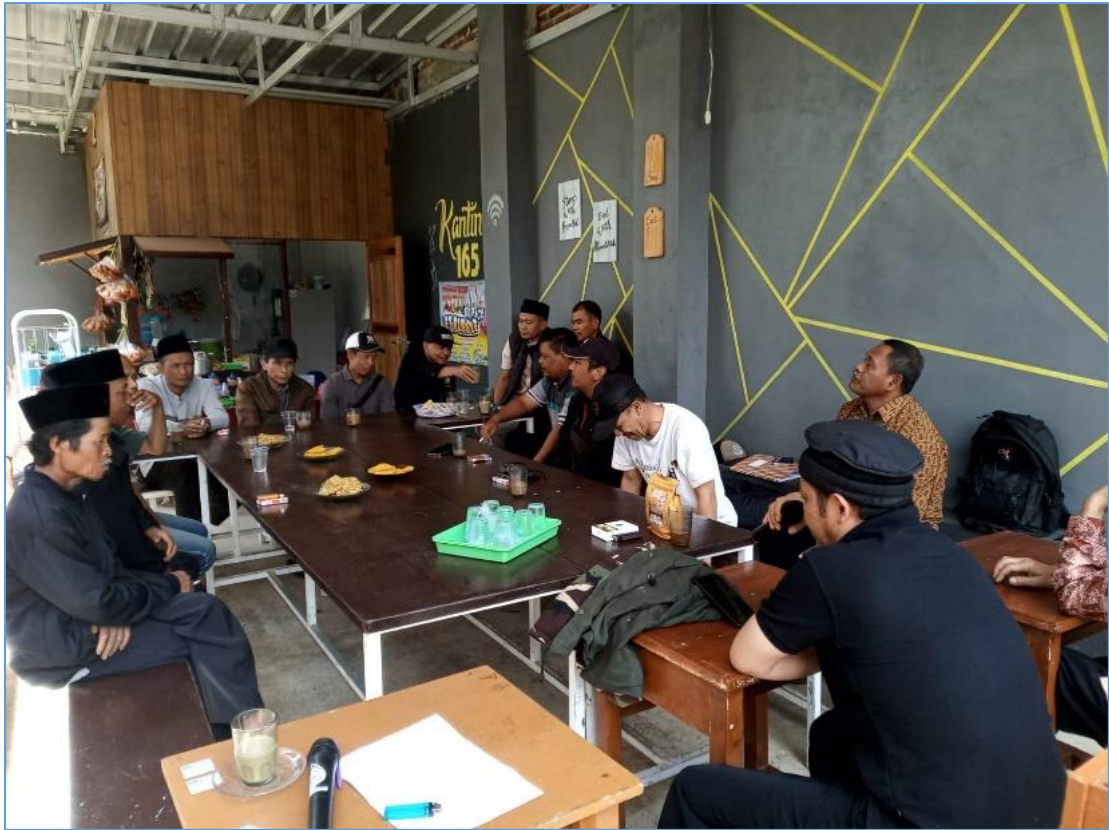
FOTO KEGIATAN KERJASAMA DENGAN PUSKESMAS