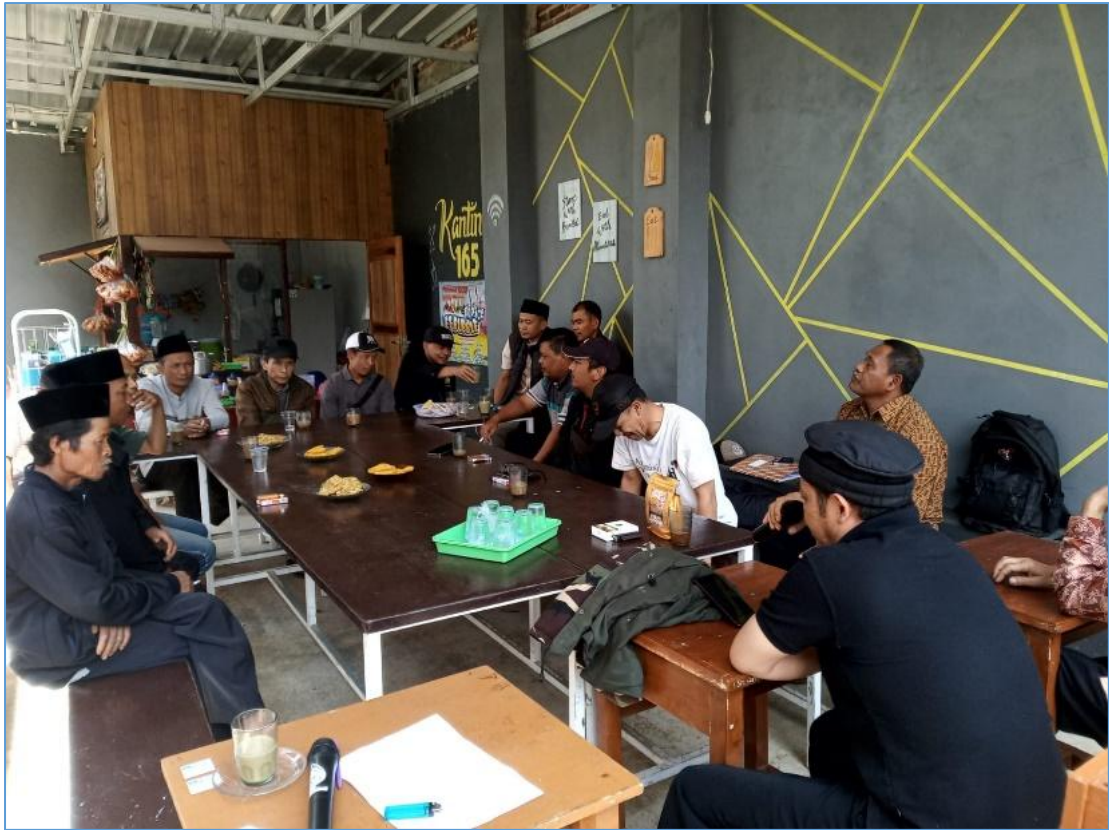
FOTO KEGIATAN KERJASAMA DENGAN PUSKESMAS