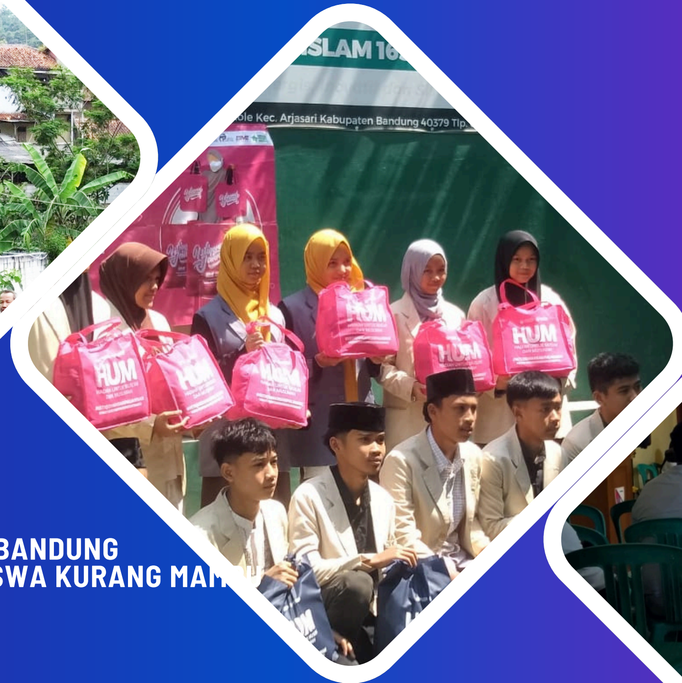
KERJASAMA DENGAN YAYASAN ISTIQOMAH BANDUNG DALAM MEMBANTU SISWA KURANG MAMPU 11 SEPTEMBER 2025