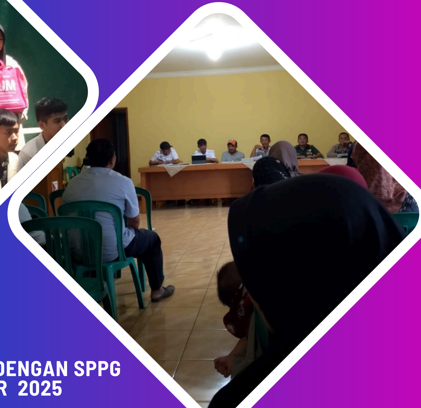
KERJASAMA DENGAN SPPG 13 SEPTEMBER 2025