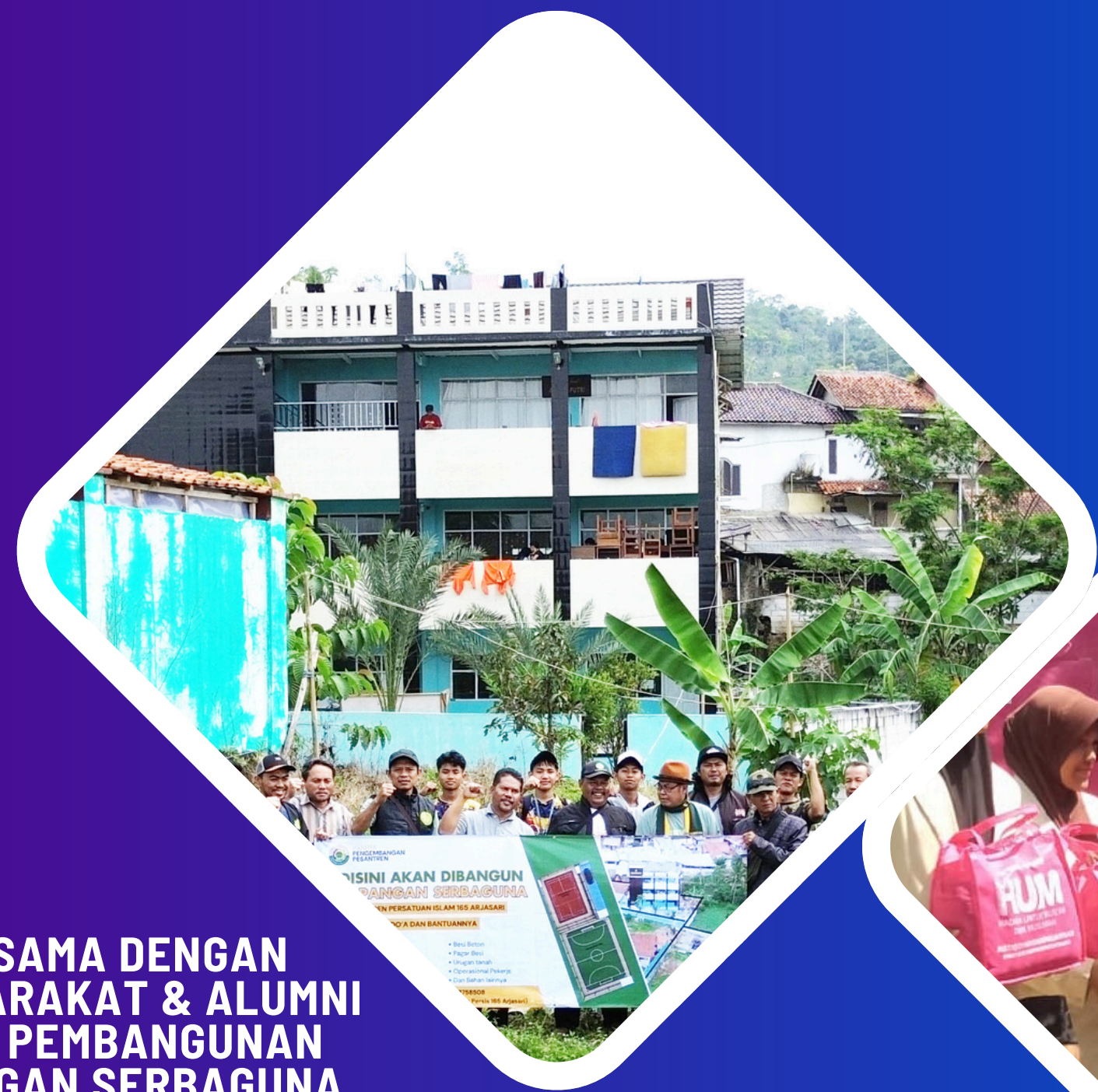
KERJASAMA DENGAN MASYARAKAT & ALUMNI DALAM PEMBANGUNAN LAPANGAN SERBAGUNA 11 AGUSTUS 2025